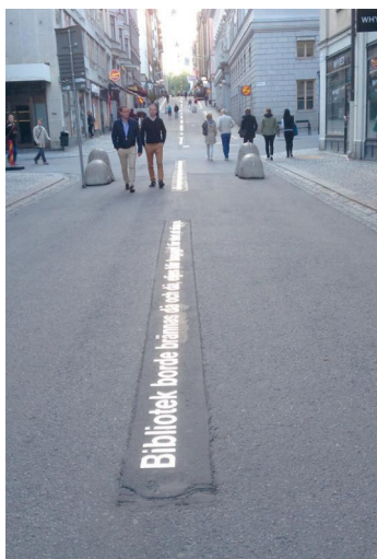
Die Straße Drottninggatan ziert ein Zitat von Johan August Strindberg.

Am Haupteingang der Bibliothek befinden sich Türgriffe in Form von Adam und Eva, deren Originale seit 2011 im Innern in einer Vitrine ausgestellt sind. Geht man hinein, öffnet sich ein kleiner Vorraum und eine Treppe zieht einen ins Innere, eine Rotunde, ähnlich dem Pantheon in Rom. Die Grundformen des Gebäudes sind das Quadrat und der Kreis. Diese sind immer wieder anzutreffen,