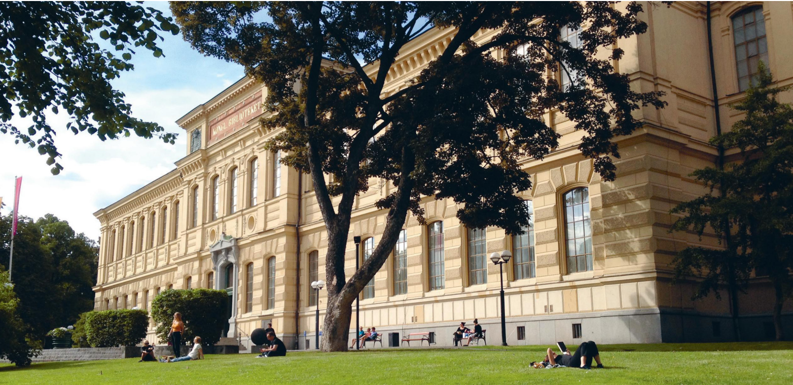
Die Kungliga biblioteket, die Schwedische Nationalbibliothek, liegt am Rande des Humlegården im Zentrum von Stockholm.