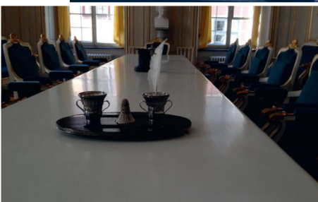
Ein Ort, an dem Geschichte geschrieben wird: Der Saal, in dem die Nobelpreise verliehen werden. Im Raum auf dem linken Foto wird vor der Nobelpreis-Verkündung ein letzter Kaffee oder Tee getrunken.