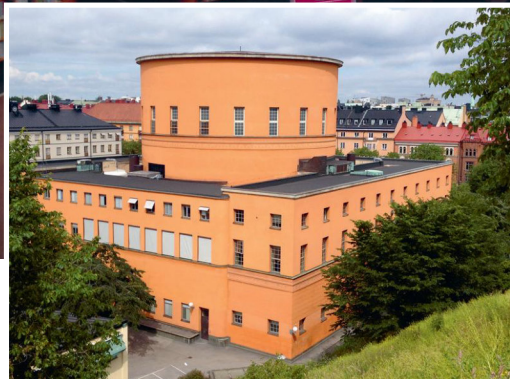
Stockholms Stadtbibliotek wurde vor 90 Jahren nach den Plänen des Architekten Gunnar Asplund eröffnet. Innen wie außen zeigt sich die Kombination aus quadratischen und runden Formen.