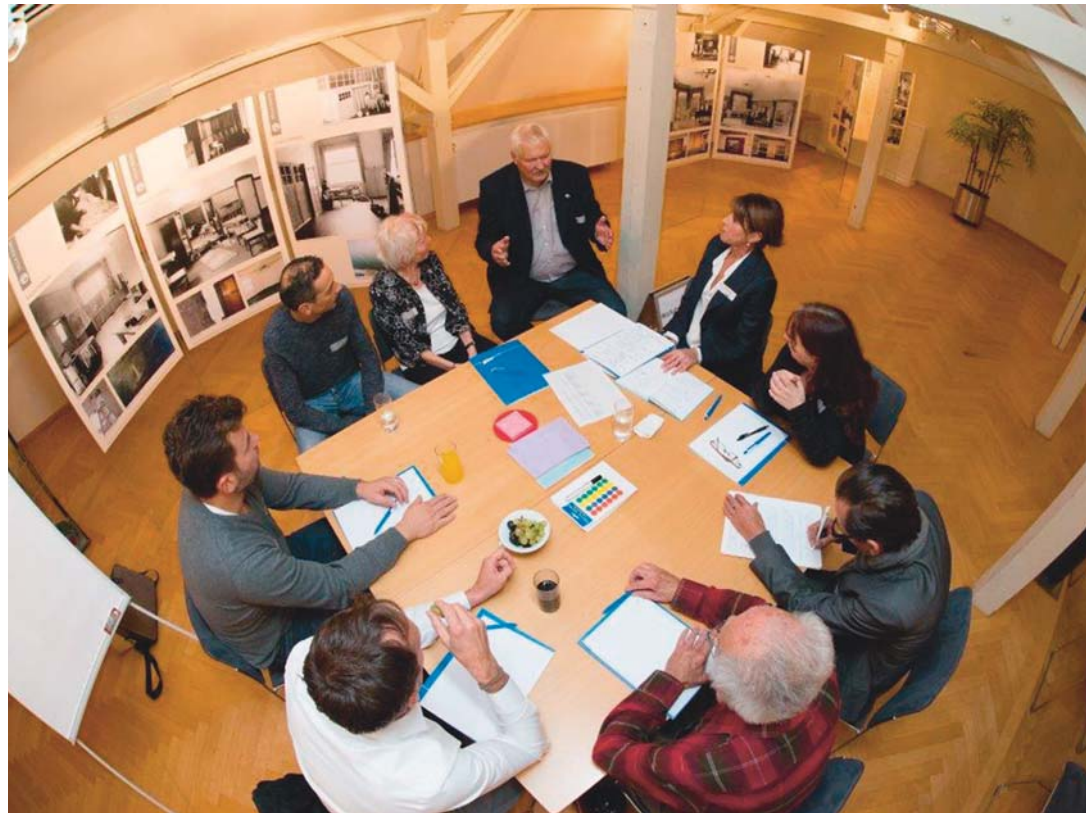
An fünf Tischen diskutierten die Teilnehmer miteinander über die Sicherheit in der Innenstadt vor dem Hintergrund der Zuwanderung.

Die Resonanz auf das Workshop-Format war durchweg positiv. Geschätzt wurde vor allem der vergleichsweise kleine Gesprächskreis, bei dem jeder zu Wort kam, bei dem jeder jedem Respekt zollte und der unter dem Leitgedanken stattfand: »Der andere könnte recht haben.« Es war die erste »Spielregel«, die als Etikette in allen Räumen ausgehängt war. Dazu gehörten außerdem: »Ich höre zu und versuche zu verstehen. Ich habe