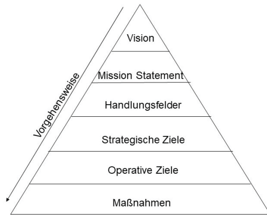
Abbildung 3: Vorgehensweise des Profilentwicklungsprozesses anhand der Zielpyramide (angelehnt an Hohbohm).

die Maßnahmen und Angebote enthalten (dargestellt als kleine Schilder an den Ästen). Das Handlungsfeld Lernen umfasst die Maßnahmen der Leseförderung, die Vermittlung von Medien- und Informationskompetenz (zum Beispiel Bibliothekseinführungen) und die Bibliothek in ihrer Funktion als Lernort. Ein weiterer Ast symbolisiert das Handlungsfeld des Treffpunktes für verschiedene