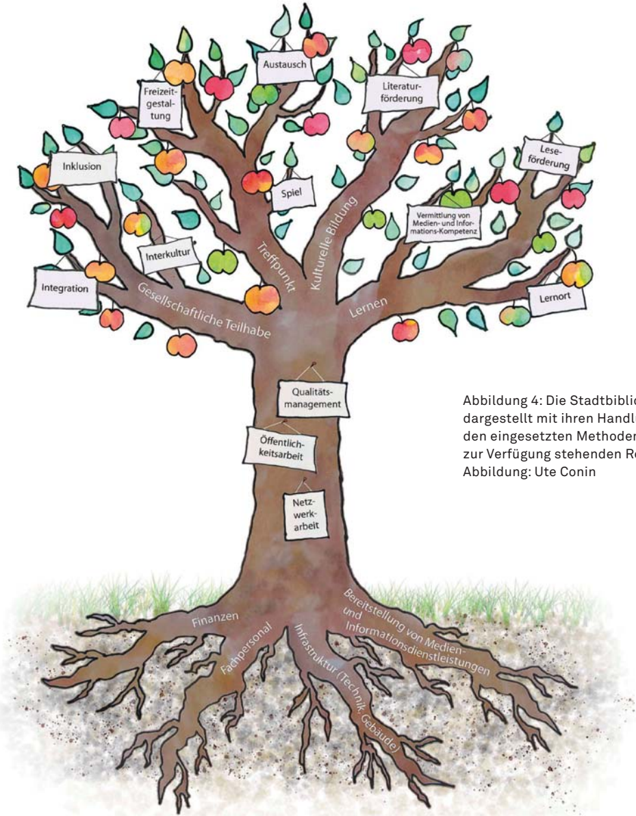
Abbildung 4: Die Stadtbibliothek als Baum dargestellt mit ihren Handlungsfeldern, den eingesetzten Methoden und den zur Verfügung stehenden Ressourcen. Abbildung: Ute Conin

vor, sukzessive und unter Einbeziehung der Mitarbeiter/-innen und Bürger/-innen, die Realisierung der neuen Strategie optisch und inhaltlich sichtbar und erlebbar werden zu lassen.