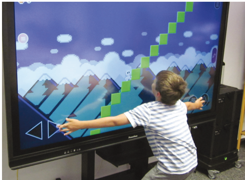
Gaming-Workshop mit Bloxels.

Der Mediengestaltung kommt eine zentrale Funktion innerhalb der handlungsorientierten Medienpädagogik zu: Wer in der Lage ist, Medien produktiv und nicht nur rezeptiv zu nutzen, hat seine Medienkompetenz selbstbestimmt erweitert. Wichtig anzumerken: Kompetenzen können nicht vermittelt werden. Ein Mensch erwirbt Kompetenzen, ein Leben lang, erweitert sie, wendet sie an. Dabei kann er unterstützt und gefördert werden, aber die Fähigkeiten selbst können nicht vermittelt werden. Trotzdem schleicht sich in bibliothekarischen Zusammenhängen – egal ob in Stellenausschreibungen, wissenschaftlicher Fachliteratur oder Veranstaltungsflyern – immer wieder die Formulierung der »Medienkompetenzvermittlung« oder »Vermittlung von Informations- oder Medienkompetenz« ein. Ein Grund dafür, mag darin liegen, dass die bibliothekarische Programmarbeit aus einem eigenen bibliothekarischen Selbstverständnis gewachsen ist, die auf einer der Grundaufgaben des bibliothekarischen Wirkens fußt, nämlich der »Vermittlung«. 9