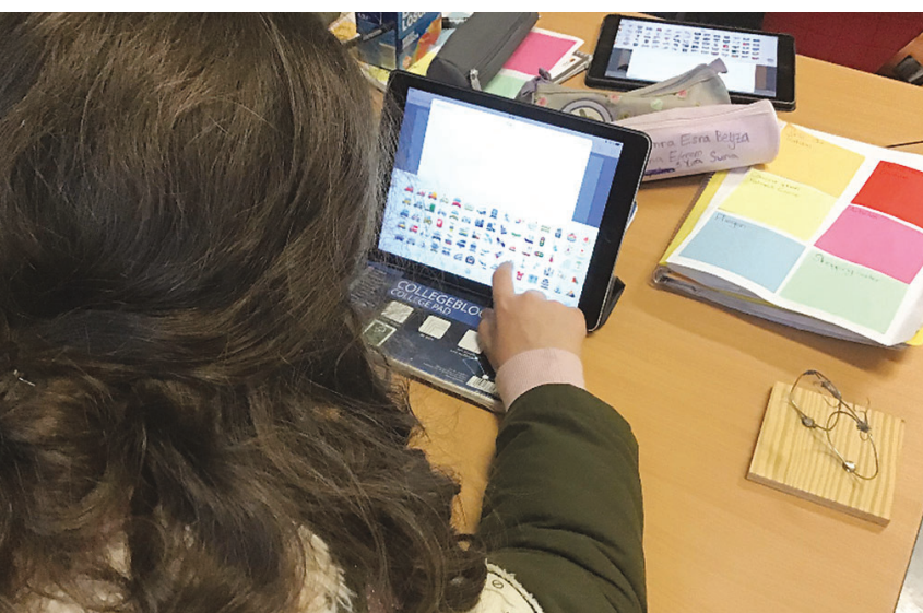
Das Efre BIST II-Projekt »Living Literature!« der Stadtbibliothek Berlin-Mitte bringt Literaturvermittlung und den gestalterischen Einsatz digitaler Medien zusammen.

Der Begriff »Medienpädagogik« taucht im erziehungswissenschaftlichen Kontext in den frühen 1960er-Jahren auf und fand zunächst breite Verwendung dort, wo Medien aller Art – außer Büchern – im Zusammenhang von Pädagogik gedacht wurden. Gerhard Tulodziecki unterteilt die Medienpädagogik in die