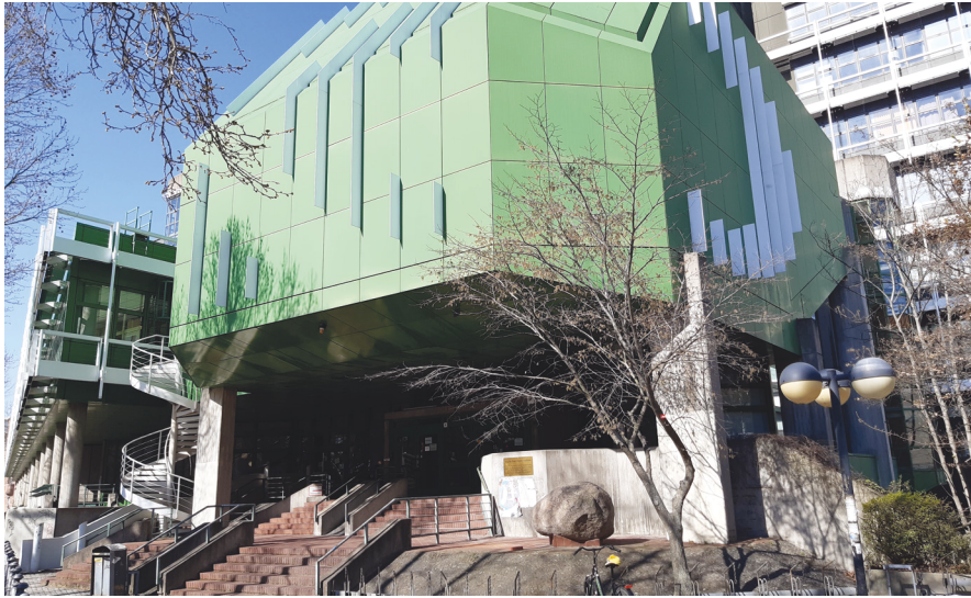
Wunschlocation für die »Beatsteaks«? Der Zugang zur früheren Bibliothek und Mensa der TU Berlin.

rudimentären Streetpunk gespielt. Später war ich auch nen paar Mal in der alten Unibibliothek der TU Berlin. In der Mensa nebenan fanden viele Konzerte, auch Punk-Rock-Konzerte statt. Da habe ich mal nen legendäres Konzert von »Sick of It All« gesehen. Das fand ich geil, denn dieser grünrote 60er-, 70er- oder 80er-Jahre Beton, mit diesem gelben Glas, das ist alles so hässlichschön mit diesem Terrazzo und den Fliesen. Dort mal zu spielen, das fände ich viel geiler als in einer Halle einer Bibliothek. Das muss so scheppern, dass unser Soundmaster fragen würde, ob wir eigentlich bescheuert sind und dass man dort auf gar keinen Fall spielen kann. Lieber würde ich dort spielen, als in der Atmosphäre einer schicken Holzbibliothek. Vielleicht wäre aber auch eine Bibliothek in som Hochhausding in Marzahn-Hellersdorf interessant – dazu solltest du auch mal Sido interviewen und fragen, ob der mal im Märkischen Viertel in der Bibliothek war.