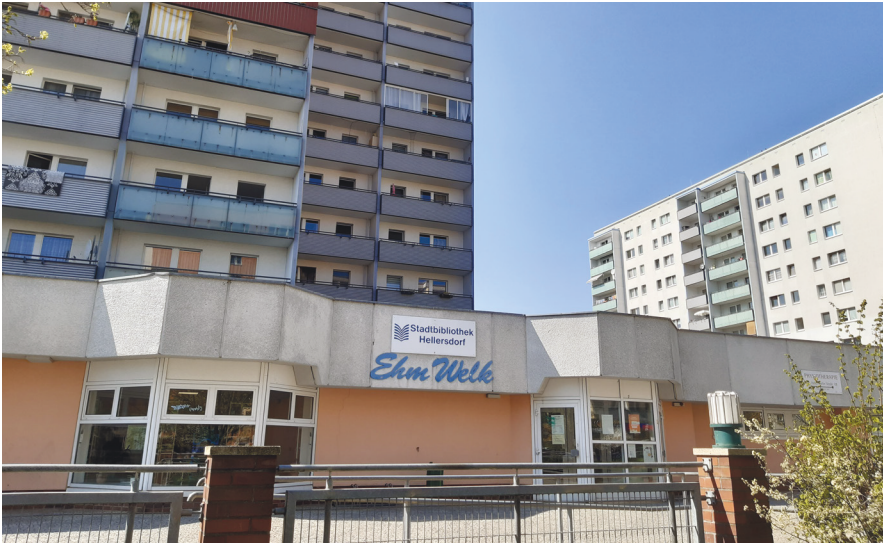
Bibliothek in der Platte: Die Mittelpunktbibliothek »Ehm Welk« in Marzahn-Hellersdorf.

andere. Wir werden uns also nicht nur fragen müssen, wer für die Gesellschaft systemrelevant ist, sondern auch, wer gesellschaftsrelevant ist. Bildungsabschlüsse sind wichtig. Wir persönlich müssen derzeit überlegen, zu welcher weiterführenden Schule unsere Tochter nach der 6. Klasse gehen wird und sie deshalb nötige Leistungen erbringen muss, um sich mit ihrem Zeugnis dafür zu bewerben. Deshalb vermittele ich ihr, dass es cool ist, etwas zu wissen und sie Bock haben sollte, etwas zu lernen und einfach mal ne ordentliche Zeitung zu lesen, statt dieses ekelhafte RTL2 zu kiek'n. Deshalb haben wir sie nun für die integrierte Sekundarstufe mit gymnasialer Oberstufe angemeldet und hoffen, dass sie da angenommen wird, da sie dort nicht im 12., sondern erst im 13. Jahr ihr Abitur machen kann.