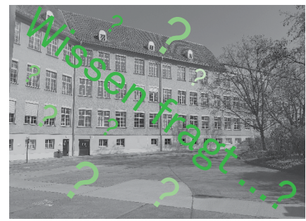
Hochschulbibliothek der FHTW Berlin

Doch ja, aber da ist die Gesellschaft gespalten. Da gibt es Leute, die sich ehrenamtlich etwas an die Backe nageln und sozial oder kulturell, auch digital, helfen