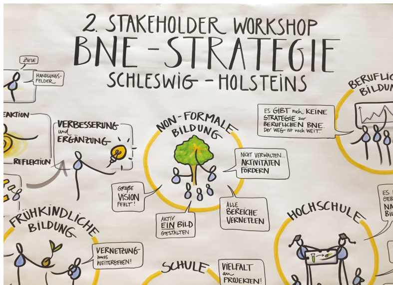
Themensammlung eines BNE-Workshops in Schleswig-Holstein.

Die Erfahrung, dass nachhaltiges Wirken nur solidarisch und mit kritischer Selbstreflexion gelingen kann, hat Konsequenzen für den Blick auf den eigenen Arbeitsbereich: Geht es mir darum, vor allem das, was wir bereits tun und oft auch gut tun, unter dem Aspekt Nachhaltigkeit nun besonders hervorzuheben? Oder lasse ich mich darauf ein, im Austausch mit anderen neu und anders auf die eigene Arbeit zu schauen, die Chance des gemeinsamen Lernens zu entdecken und