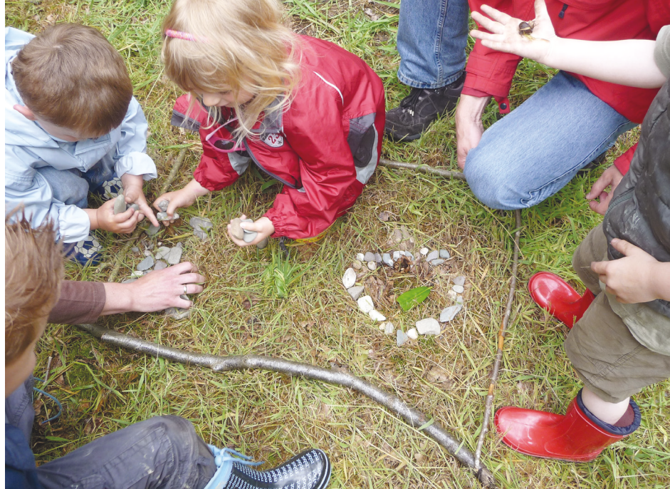
Ein wesentlicher Bestandteil der Bildung für nachhaltige Entwicklung: Geschichten erzählen von und mit der Natur.

»Was bewegt Menschen eigentlich zu umweltgerechtem, nachhaltigkeitsorientiertem Handeln? Es ist eben nicht das Wissen, was mich treibt, sondern es ist ein emotionaler Zugang. Der erste Reflex ist immer: Man muss es den Menschen nur sagen, dann machen sie's. Und genau das – das wissen wir – funktioniert eben nicht; es ist nicht das kognitive Durchdringen. Es braucht einen Perspektivwechsel, und das kann kulturelle Bildung recht gut, mit anderen Methoden und Zugängen als wir das bisher probiert haben.« 4