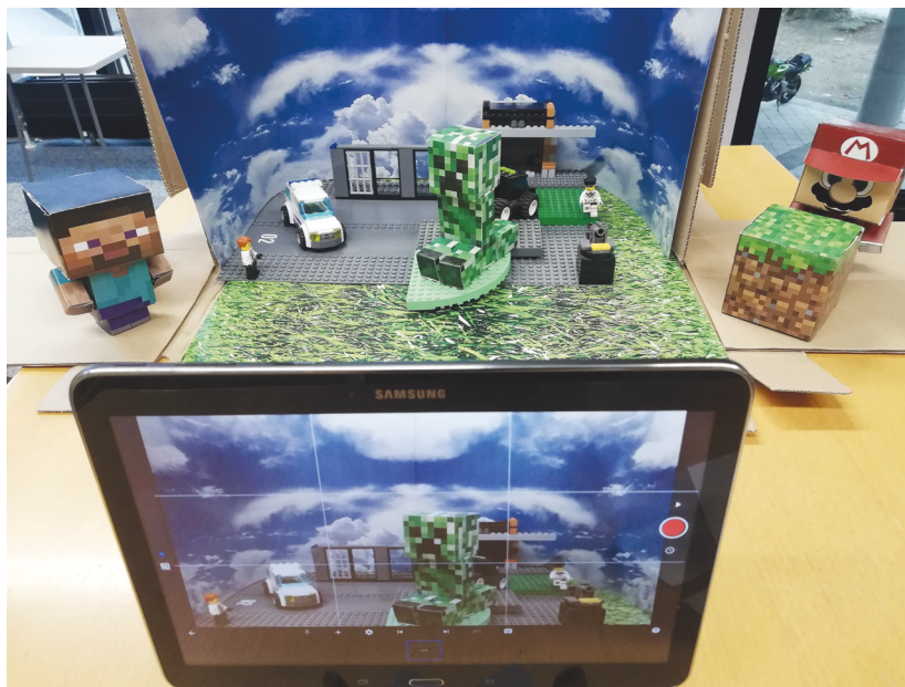
Einblick in eine Stopmotion-Station bei der Minecraft-Veranstaltung der Stadtbibliothek Saarbrücken.

Einerseits waren Mädchen als Mitspielende immer noch in der Minderzahl, andererseits wurden wir häufig von Mädchen an der Infotheke gefragt, ob wir ihnen eine Einführung geben und gemeinsam mit ihnen spielen könnten. Da es aus personellen Gründen manchmal schwierig ist, ad hoc zu reagieren, entstand die Idee zu den »GamingGirls«, die sich zunächst einmal monatlich in einer ebenfalls offenen Runde treffen können.