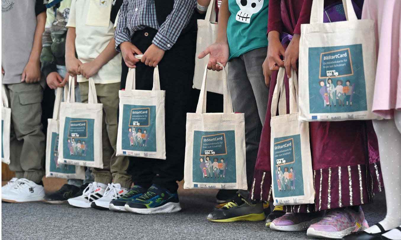
Die Erstklässler/-innen erhalten zu Schulbeginn einen BibStartCard-Beutel mit kostenfreiem Bibliotheksausweis.