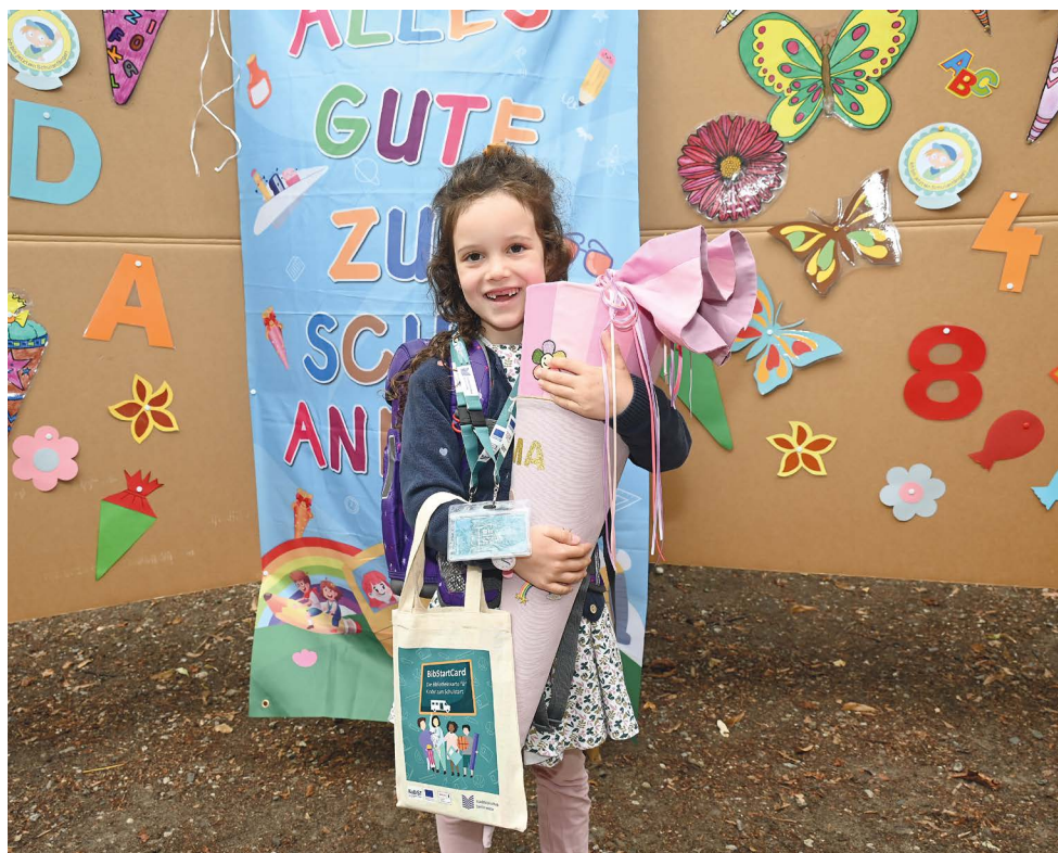
Leuchtende Augen am Einschulungstag – mit dem BibStartCard-Beutel.

Von 581 eingeschulten Kindern der Projektschulen erhielten 2025 insgesamt 78 Prozent einen Bibliotheksausweis und konnten sich direkt im An-